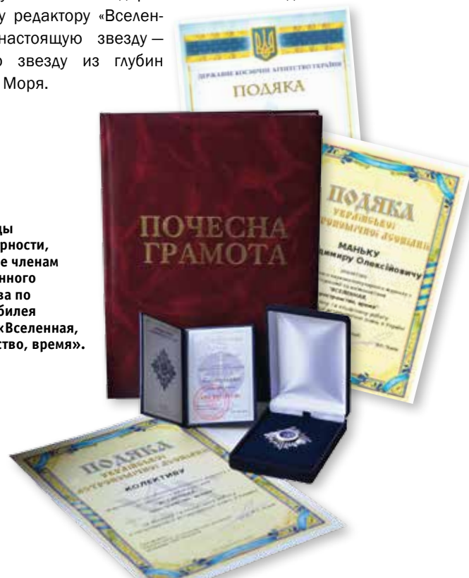
► Награды и благодарности, врученные членам редакционного коллектива по случаю юбилея журнала «Вселенная, пространство, время».